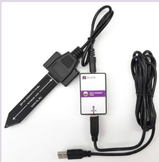
Рис. 4. Датчик влажности почвы

Датчик влажности почвы — предназначен для измерения степени увлажнения почвы, выраженной в процентах. Применяется в агроэкологических и сельскохозяйственных исследованиях.