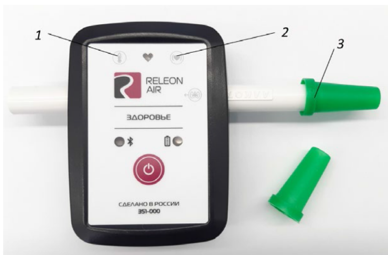
Рис. 3. Мультидатчик по физиологии. Обозначение разъемов и технологических отверстий: 1 — температура тела, 2 — пульс, 3 — частота дыхания (надет съёмный мундштук)

Мультидатчик по физиологии позволяет определять артериальное давление, пульс, температуру тела, частоту дыхания, ускорение движения (рис 3).