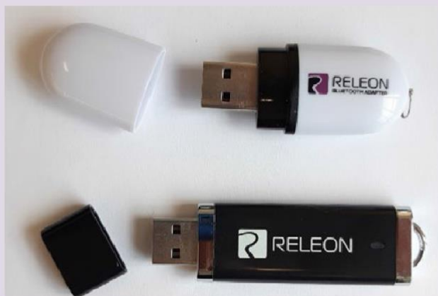
Рис. 13. Общий вид USB-флеш-накопителя (внизу) и Bluetooth-адаптера (вверху) Releon

В комплекте цифровой лаборатории Releon поставляется программное обеспечение Releon Lite на USB-флеш-накопителе, а также Bluetooth-адаптер для связи регистратора данных с беспроводными датчиками (рис. 13).