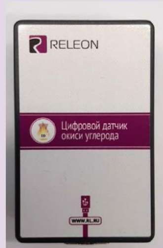
Рис. 11. Датчики кислорода (слева) и угарного газа (справа)