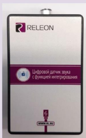
Рис. 7. Датчик звука

Датчик звука — измеряет уровень шумов в окружающей среде и при оценке шумопоглощающих изоляторов. Динамический диапазон: от 30 до 130 дБ. Частотный диапазон: от 50 Гц до 8 кГц. Разрешение: 0,1 дБА (акустические децибелы). Технологические особенности: датчик чувствителен к резким звукам, которые могут дать завышенные результаты измерений.