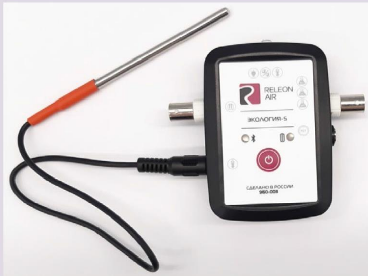
Рис. 6. Датчик температуры растворов

Датчик температуры термопарный предназначен для измерения температур до 900. Используется при выполнении работ, связанных с измерением температур плавления и разложения веществ, а также для измерения температуры в экзотермических процессах.