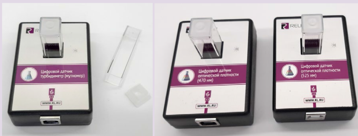
Рис. 8. Датчики мутности (слева), оптической плотности на 465 нм (в центре) и 525 нм (справа)

В комплект входят датчики с различной длиной волн полупроводниковых источников света: 465 и 525 нм. Диапазон измерения коэффициента пропускания света: от 0 до 100 %. Разрешение при измерении коэффициента пропускания: 0,1 %. Диапазон измерения оптической плотности: от 0 до 2 D. Разрешение при измерении оптической плотности: 0,01 D. Длина оптического пути кюветы: 10 мм. Объём кюветы: 4 мл. Технологические особенности: требуется хорошо промывать кювету для исследуемого раствора.