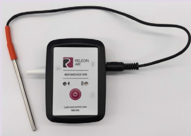
Рис. 12. Датчик температуры тела

Датчик температуры тела — предназначен для непрерывного измерения температуры тела в подмышечной впадине. Оснащён выносным зондом. Диапазон измерения: от 25 до 50 °С. Разрешение датчика: 0,1 °С. Технологическая особенность: для точного измерения в подмышечной впадине должна находиться вся металлическая часть зонда.