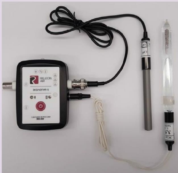
Рис. 10. Ионоселективный датчик (присоединены электро хлорид-ионов и электрод сравнения)

Датчик кислорода — предназначен для определения относительной концентрации кислорода в воздухе. Диапазон измерения: от 0 до 100 %. Разрешение: 0,1 %. Технологические особенности: при измерении содержания газа в выдыхаемом воздухе необходимо держать мембрану максимально близко ко рту; восстановление показаний на воздухе происходит через 1—2 минуты (время диффузии через мембрану).