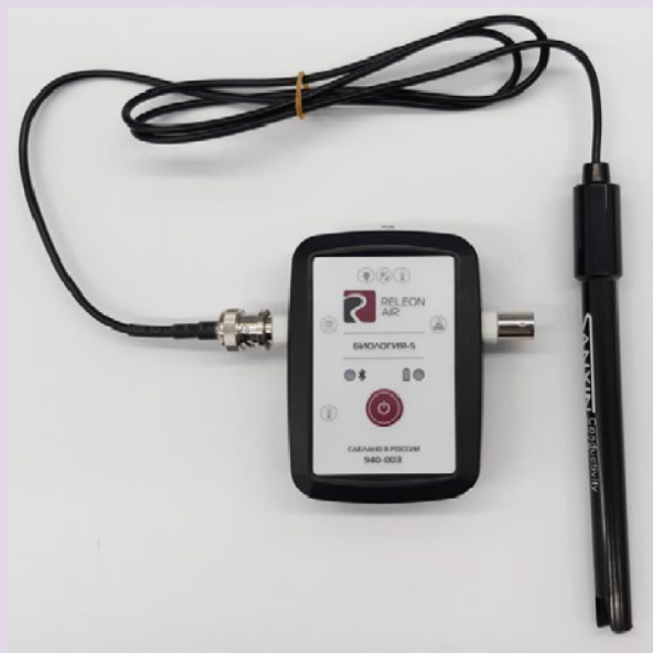
Рис. 5. Датчики электропроводимости

Датчик электропроводимости — предназначен для регистрации и измерения удельной электропроводности жидких сред, в том числе и водных растворов веществ. Применяется при изучении характеристик водных растворов, в том числе почвенных вытяжек.