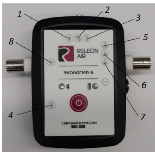
Рис. 2. Мультидатчик по экологии. Обозначение разъёмов и технологических отверстий: 1 — освещённость, 2 — относительная влажность воздуха, 3 — температура окружающей среды, 4 — температура растворов, 5 — нитрат-ионы, 6 — хлорид-ионы, 7 — pH, 8 — электропроводность

Мультидатчик по экологии позволяет измерять следующие показатели: водородный показатель водных сред, концентрации нитрат-ионов и хлорид-ионов, электропроводность, влажность, освещённость, температуру окружающей среды, температуру растворов, растворов и твёрдых тел (рис. 2).